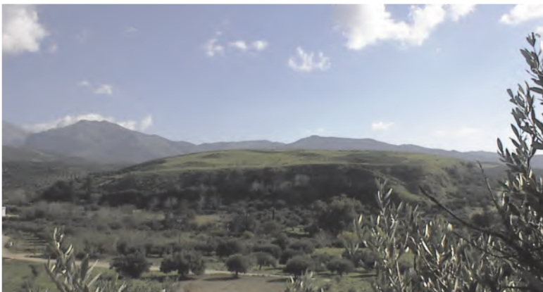
Εικ. 1: Η Κεφάλα

Πολλοί είναι οι ερευνητές, ανάμεσα τους και ο γάλλος Πολ Φορ, που τοποθετούν το οικιστικό και/ή το πολιτικό κέντρο ή μια από τις πιο σημαντικές κώμες της αρχαίας πόλης των Αρκάδων στο ύψωμα Κεφάλα Ινίου 1 , νότια από το χωριό (η πόλη φιλολογικά και μεταγενέστερα αναφέρεται και ως Αρκαδία 2 - εννοείται - χώρα). Την άποψη αυτή ακολουθεί ο Ιαν Σάντερς 3 , που αναφέρει και τη σχετική βιβλιογραφία, ενώ καταγράφει και τις προσωπικές του παρατηρήσεις από την επίσκεψη του τόπου.