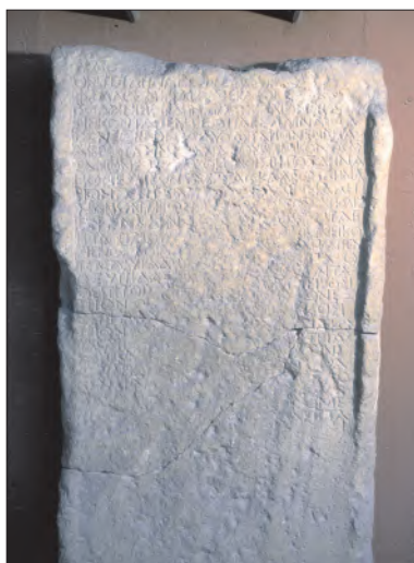
Εικ. 9: Επιγραφή μισθοδοσίας και σκευών

Τη θέση της πόλης Αρκάδες επαινούν ο Θεόφραστος και ο Πλίνιος για τις πηγές της 34 . Η παράδοση αυτή δικαιώνεται, κατά τον Ίαν Σάντερς με την παρουσία της πλούσιας πηγής δίπλα στην εκκλησία Ζωοδόχο Πηγή, στη θέση του παλιού σημερινού μικρού φράγματος, αλλά και με τον νερόμυλο στα ανατολικά της Κεφάλας, ενώ και τα ερείπια των αρχαίων υδραγωγείων και των αρχαίων λουτρών, σήμερα όχι και σε πολύ καλή κατάσταση, αλλά πριν από 30 χρόνια ήταν εντυπωσιακά, όπως δείχνουν οι φωτογραφίες της εποχής 35 .