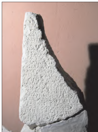
Εικ. 4: Επιγραφή της συνθήκης Αρκάδων Ιεραπυτνίων 150π.χ. όψη Α

ανανέωση της φιλίας της πόλης τους «προς τε το κοινόν και την πόλιν των Αρκάδων». Η επιγραφή αυτή ενίσχυσε ουσιαστικά την άποψη ότι εδώ βρισκόταν η πόλη και το πολιτικό κέντρο του κοινού των Αρκάδων.