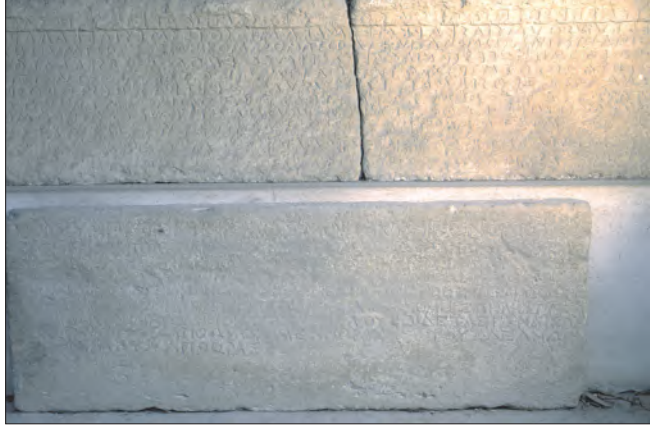
Εικ. 2: Επιγραφή Βαλανεΐου

Το πολιτικό και διοικητικό κέντρο της πόλης και του Κοινού των Αρκάδων άλλοι ερευνητές (Ξανθουδίδης 5 , Αλμπερ 6 ) τοποθετούσαν στον λόφο Προφήτη Ηλία στο χωριό Αφρατί, σήμερα στον Δήμο Βιάννου.