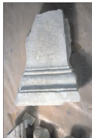
Εικ. 6: Μαρμάρινη παραστάδα

Από τους αρχαίους συγγραφείς ο Πολύβιος αναφέρει ότι στον πόλεμο της Κνωσού με τη Λύκτο το 221, οι Αρκάδες ήταν μια από τις πρώτες πόλεις που εγκαταλείψανε την Κνωσό και συνασπίστηκαν με τη Λύκτο. Ένα ανέκδοτο, που αναφέρουν ο Σενέκας και ο Πλίνιος, ότι δήθεν τα ποτάμια των Αρκάδων στέρεψαν όταν ερημώθηκε η πόλη και ξαναέτρεξαν όταν άρχισε πάλι να καλλιεργείται και να κατοικείται η περιοχή της, ίσως δηλώνει κάποια καταστροφή ανάλογη με της συμμάχου της Λύττου.