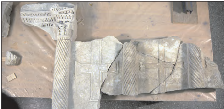
Εικ. 7: Μαρμάρινο θωράκιο

Ευχαριστώ όλους τους συνεργάτες μου, αρχαιολόγους και τεχνίτες. Ιδιαίτερα ευχαριστώ το δήμαρχο Αρκαλοχωρίου Χαράλαμπο Γιαννόπουλο για τη συμπαράσταση του, και τον τότε προϊστάμενο της 13ης ΕΒΑ συνάδελφο και φίλο κ. Μιχάλη Ανδριανάκη που μου ανέθεσε τη διεύθυνση της ανασκαφής.