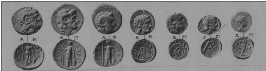
Εικ. 8: Νομίσματα

Η πόλη είναι γνωστή και από τα νομίσματα της, που αρχίζει να τα κόβει στα τέλη του 4ου αιώνα π.Χ. Ο Σβορώνος περιγράφει και εικονίζει επτά νομίσματα σε δύο κύριους τύπους: ο πρώτος τύπος είχε στην κύρια όψη την κεφαλή του Δία Άμμωνα που κοιτάζει δεξιά και στην πίσω όψη την Αθηνά Παλλάδα και τη λέξη ΑΡΚΑΔΩΝ σε δύο ομάδες γραμμάτων. Ο δεύτερος τύπος έχει στην πρόσθια όψη την κεφαλή της Αθηνάς, ενώ στην οπίσθια όψη τον Δία κεραυνοφόρο γυμνό και την επιγραφή με τέσσερα γράμματα ΑΡΚΑ 25 .