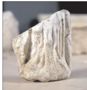
Εικ. 3: Αγαλματίδιο Αθηνάς

Αξίζει να αναφερθεί ότι, λόγω της εξαντλητικής ανασκαφής από τον Ντόρο Λέβι στα νεκροταφεία των Αρκάδων στο Αφρατί, το σύνολο των αγγείων της γεωμετρικής και αρχαϊκής εποχής που προήλθε από εκεί είναι το δεύτερο μεγάλο, ύστερα από εκείνο της Κνωσού, σύνολο στην Κρήτη της εποχής. Αρχικά το εργαστήριο αγγειογραφίας των Αρκάδων ήταν κάτω από