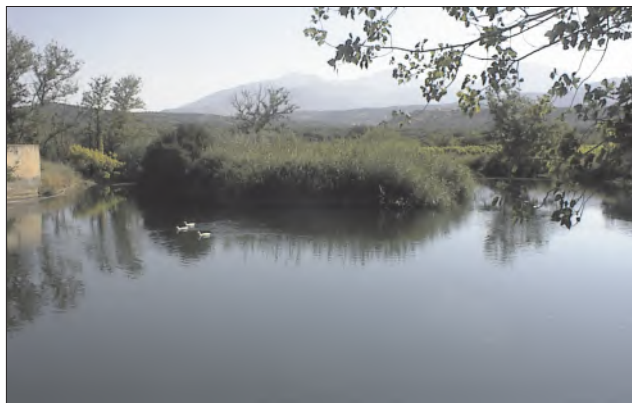
Εικ. 10: Παλιό φράγμα